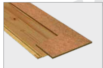
Understruktur med HDF plate.

Lengde: 2200 mm Bredde: 209 mm m 2 pr. bord: 0,46 m 2 Antall bord pr. pk.: 4 m 2 pr. pk.: 1,84 m 2 Pk. pr. palle: 40 m 2 pr. palle: 73,60 m 2 Vekt pr. palle: 793,60 kg