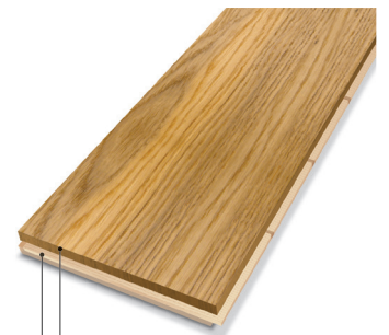
— Strato nobile: legno massello — Strato di base: Abete